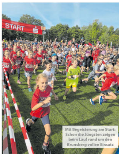
Mit Begeisterung am Start: Schon die Jüngsten zeigen beim Lauf rund um den Brunsberg vollen Einsatz

Damen und Herren werden mit Pokalen geehrt, die Siegerin und der Sieger der Bergwertung auf dem Brunsberg dürfen das traditionsreiche Bergtrikot überstreifen, und für alle Kinder gibt es Medaillen sowie Urkunden. Außerdem werden die besten Teams im Teamcup über fünf und 11,7 Kilometer ausgezeichnet. Auch in diesem Jahr gibt es die Möglichkeit, Laufshirts für Kinder direkt am Veranstaltungstag zu erwerben – ein schönes Andenken an den besonderen Tag.