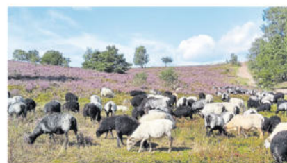
Typisch für die Region: Die Läuferinnen und Läufer passieren auch die blühende Heide mit Heidschnucken

Vesperweg, Niedersachsenweg und Lohbergerweg wird es wegen des Sportereignisses zu Behinderungen durch die Läuferinnen und Läufer kommen. Umleitungen sind ausgeschildert. Auch der Buchholz Bus wird umgeleitet. Parkmöglichkeiten gibt es z. B. bei den Supermärkten Rewe und Penny. Es wird aber empfohlen, auch die öffentlichen Verkehrsmittel zu nutzen.